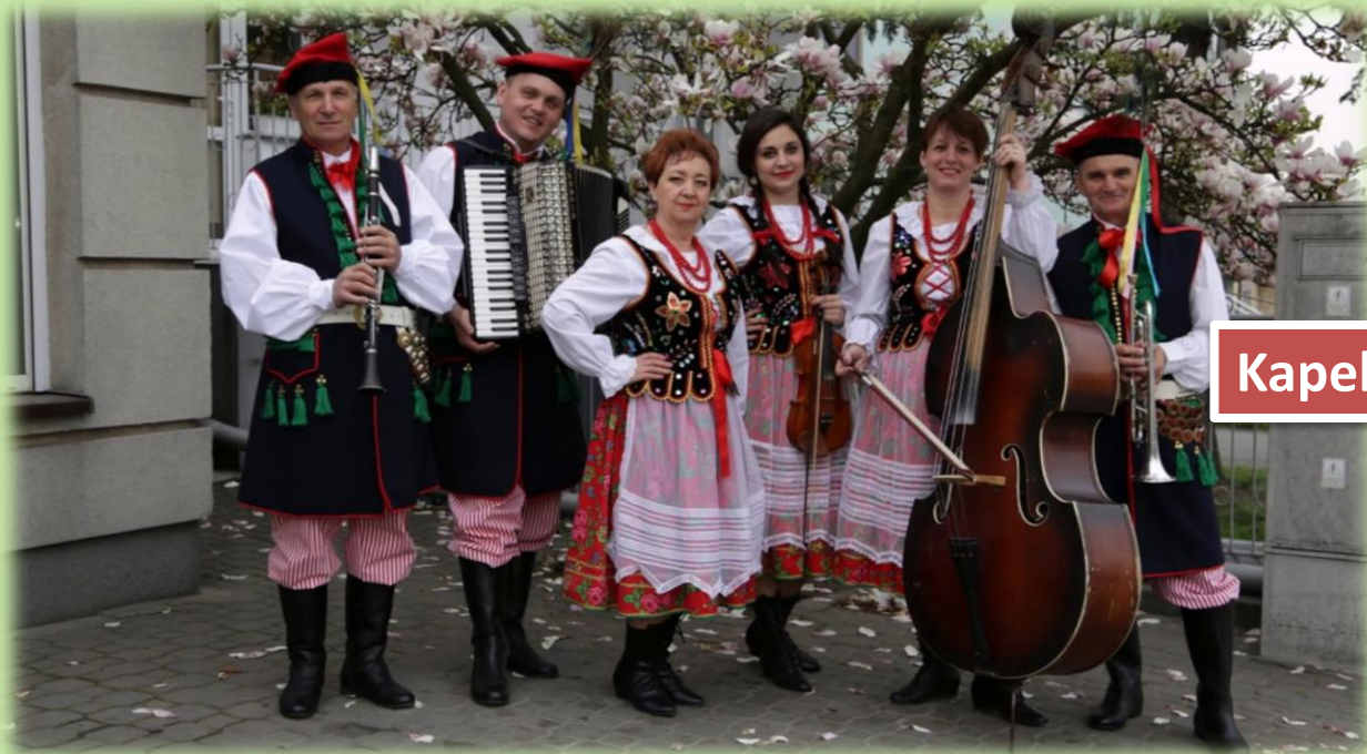
Kapela ludowa z okolic Krakowa