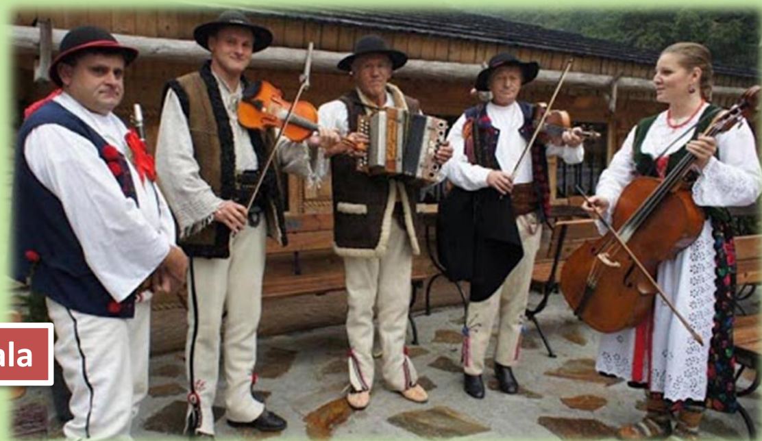
Kapela ludowa z Podhala