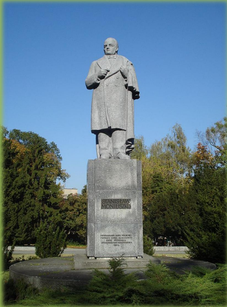
Pomnik w Częstochowie