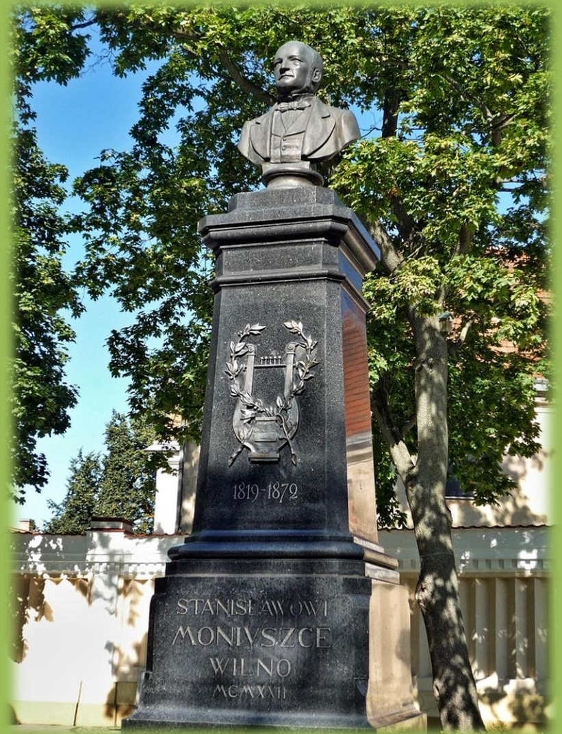
Popiersie w Wilnie