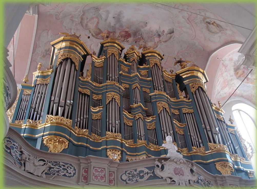
Organy w kościele św. Jana Chrzciciela i św. Jana Ewangelisty w Wilnie, na których grał Stanisław Moniuszko