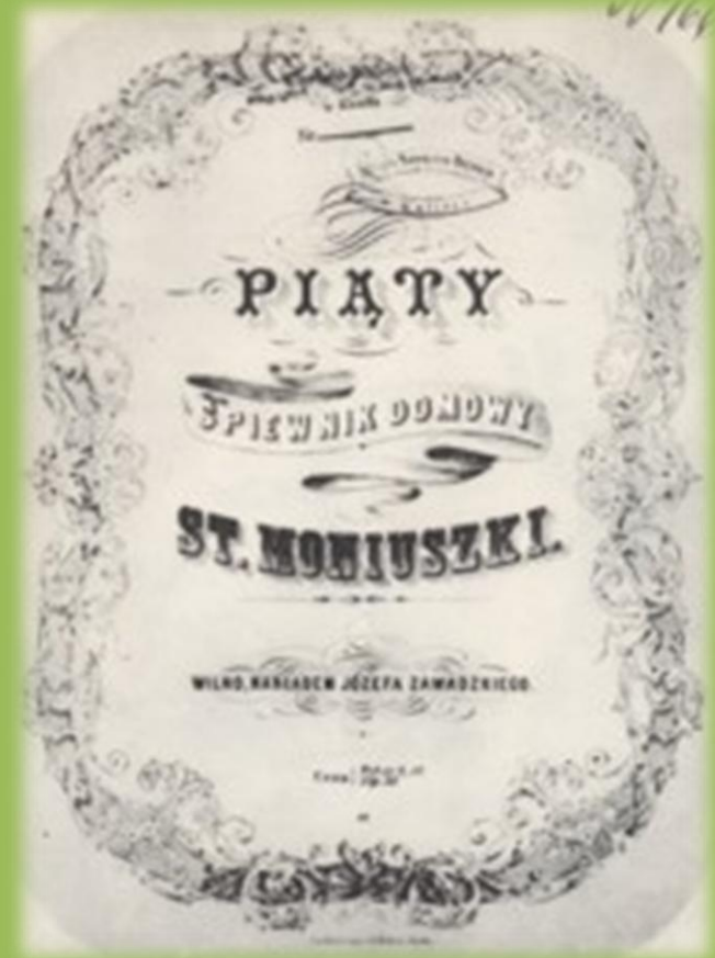
Oktładka piątego Śpiewnika domowego Stanisława Moniuszki