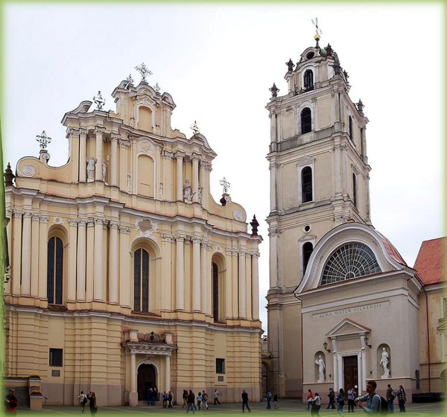
Kościół św. Jana Chrzciciela i św. Jana Apostoła i Ewangelisty w Wilnie, w których Moniuszko pracował jako organista